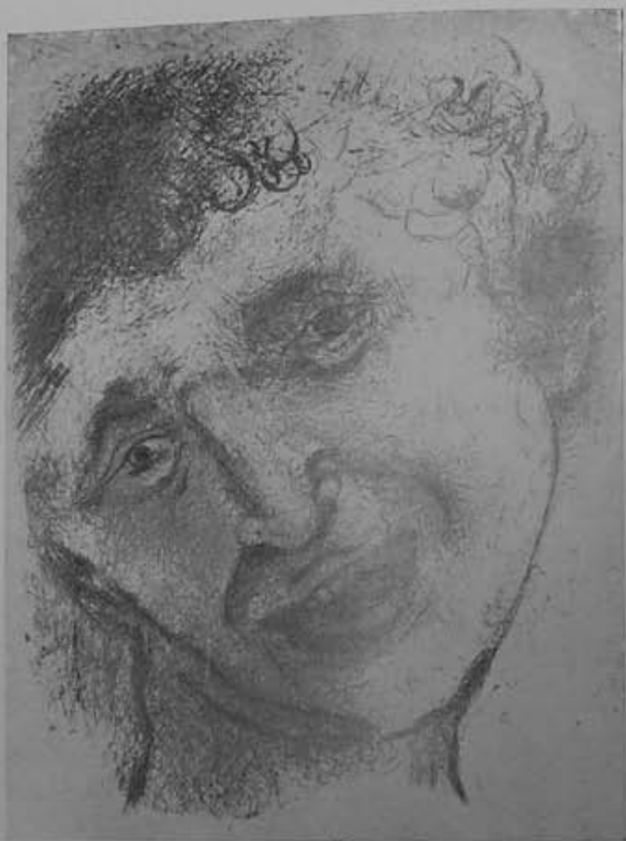
Chagall, M. 15.