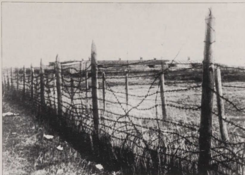
Joonis 1. Okastraat Tartu laagri ümber.